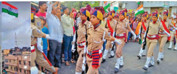
ચોક ખાતે આયોજિત કાર્યક્રમમાં સવારે સરદાર ચોકથી ઝંડાયોક સુધી માર્ચ પાસ્ટ કરવામાં આવ્યું હતું. તથા વિવિધ સંસ્થાઓ શાળા-કોલેજોએ સાંસ્કૃતિક કૃતિઓની સાથે વિવિધ ઝાંખીઓ રજૂ કરી હતી.

આઝાદીના અમૃત મહોત્સવ અંતર્ગત હર ઘર તિરંગા મહોત્સવ હેઠળ વાપી નગરપાલિકાના જસ્મા તિરંગા કા કાર્યક્રમ હેઠળ શનિવારે સરદાર ચોક ખાતે વલસાડ જિલ્લાના સૌથી ઊંચા રાષ્ટ્રધ્વજને રાજ્યના નાણા, ઊર્જા અને પેટ્રોકેમિકલ મંત્રી કનુભાઈ દેસાઈના હસ્તે લહેરાવવામાં આવ્યો હતો. વાપી નગરપાલિકા દ્વારા સરદાર