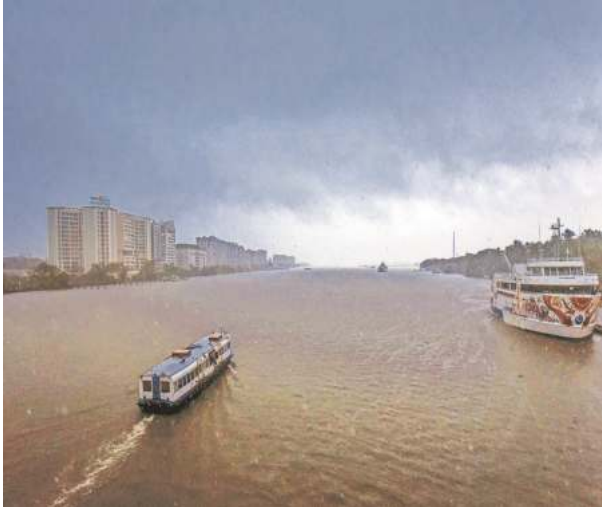
Dark clouds hover over Kochi on Wednesday, ahead of the onset of the Southwest Monsoon.