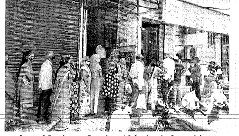
નવસારી નગરપાલિકા વલકામાં સોશિયલ ડિસ્ટન્સિંગના ધજિયા ઉભા કરવામાં આવ્યા હતાં. જોકે વલકામાં બેંકની લાંબી લાઈનને કારણે સોશિયલ ડિસ્ટન્સિંગના ધજિયા ઉભા કરવામાં આવ્યા હતાં.